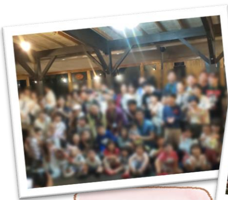
みんな大はしゃぎでした

7月末に毎年恒例 Ohana のサマーキャンプが開催されました。今回は、過去最高 100 人を超える患者・家族の方々にご参加いただきました。台風上陸のため生憎の天気となりましたが、BBQ やスイカ割、夜のレクリエーションなど多くの仲間と素敵な時間を過ごし、最高の笑顔が溢れた2日間となりました。来年も多くのご参加をお待ちしています。ありがとうございました。